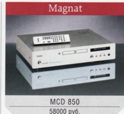
MCD 850 58000 руб.

За кратковременный предварительный прогрев модель вознаграждает слушателя богатым, живым и характерно теплым (т.н. ламповым) звучанием. В связи с этим рекомендуем ее любителям «винила» — она успешно приближает цифровые записи к лучшему аналоговому. Однако здесь необходимо тщательно подобрать усилитель — не всякий аппарат способен раскрыть потенциал этого необычного проигрывателя.