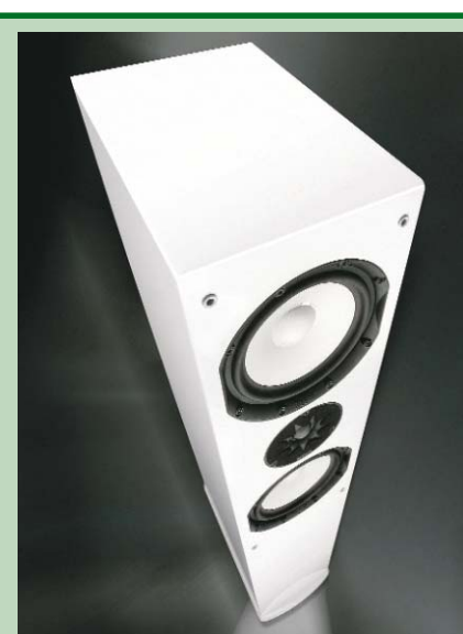
«Белый альбом» — Magnet Quantum 705 White Edition

приверженность к качеству и надежности, которые не вызывают сомнений, как не вызывает сомнений звуковая верность аппаратуры Magnet. Слушатель должен получать любимую музыку без каких-либо, даже самых малейших, искажений! Сегодня «магнаты» покупает почти вся Европа. Вы собрались обустроить домашний кинотеатр или «зарядить» автомобиль мощным звуком? Компания предлагает огромное